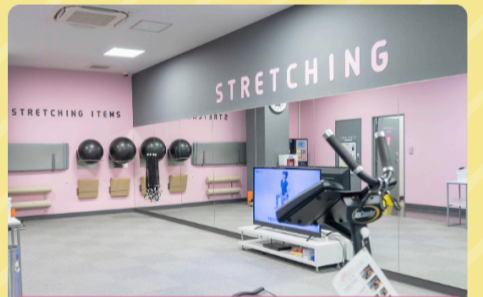
ストレッチエリア